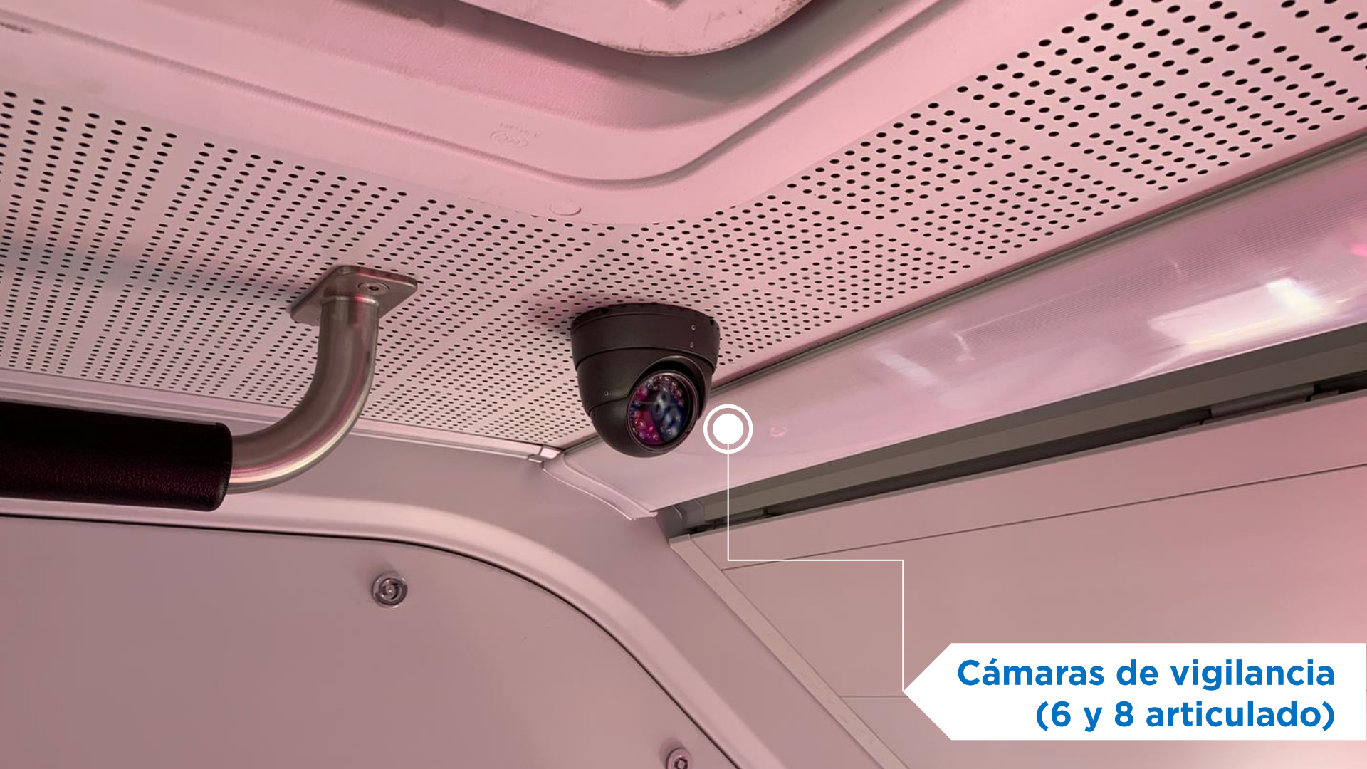
Cámaras de vigilancia (6 y 8 articulado)