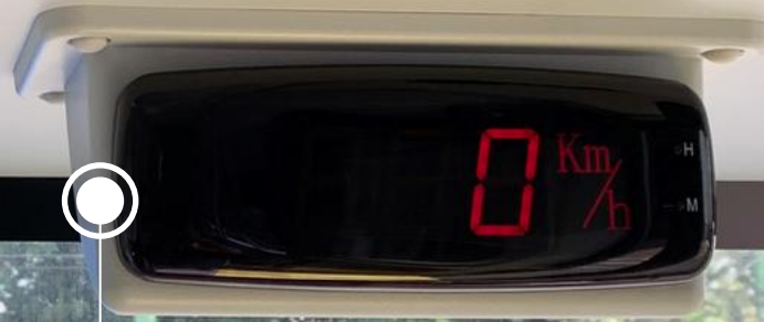
Monitor de velocidad